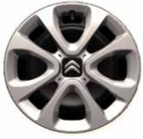
Staal 15" + wielplaat 'ARROW' 195/65 R15T