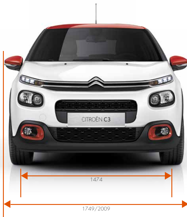
Breedte / Breedte met uitgeklapte buitenspiegels