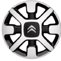
Lichtmetaal 17" Diamantée 'CROSS' 205/50 R17T