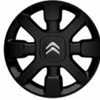
Lichtmetaal 17" Diamantée 'CROSS BLACK' 205/50 R17T