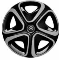
Staal 16" + wielplaat 'STEEL & STYLE 3D' 205/55 R16T